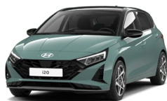
Mangroove Green Pearl Perleťová Cena: 0 Kč