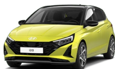
Lucid Lime Metallic Metalická Cena: 13 900 Kč