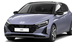
Meta Blue Pearl Metalická Cena: 13 900 Kč