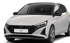
Lumen Gray Pearl Perleťová Cena: 13 900 Kč