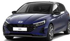
Vibrant Blue Pearl Perleťová Cena: 13 900 Kč