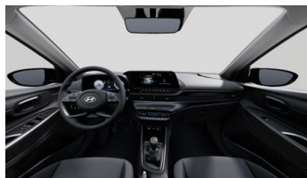
Černý Obsidian Black interiér – černé čalounění sedadel – světlé čalounění stropu a obložení bočních sloupků – černé provedení přístrojové desky a středové konzoly – černé provedení výplní dveří