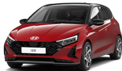
Dragon Red Pearl Perleťová Cena: 13 900 Kč