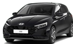
Phantom Black Pearl Perleťová Cena: 13 900 Kč