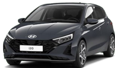
Aurora Gray Pearl Perleťová Cena: 13 900 Kč