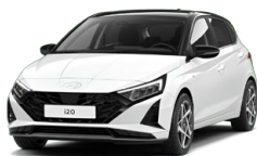
Atlas White Speciální pastelová Cena: 5 000 Kč