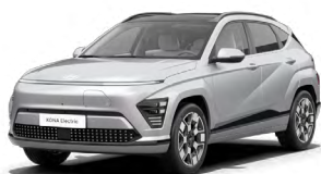
Shimmering Silver Metalická Kombinace s černým lakováním střechy Cena: 17 900 Kč