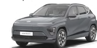
Ecotronic Gray Perleťová Kombinace s černým lakováním střechy Cena: 17 900 Kč