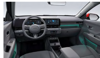
Eco interiér – čalounění sedadel kůže/semiš – výhradně pro Style