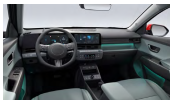
Šalvějově zelený interiér – kožené čalounění sedadel – výhradně pro Style Premium