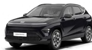
Abbyss Black Pearl Perleťová Cena: 17 900 Kč