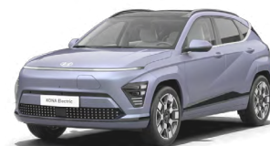
Meta Blue Pearl Metalická Kombinace s černým lakováním střechy Cena: 17 900 Kč