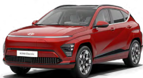
Ultimate Red Metalická Kombinace s černým lakováním střechy Cena: 17 900 Kč