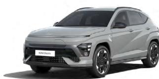
Shadow Grey Speciální pastelová Kombinace s černým lakováním střechy Cena: 17 900 Kč Pouze pro N Line