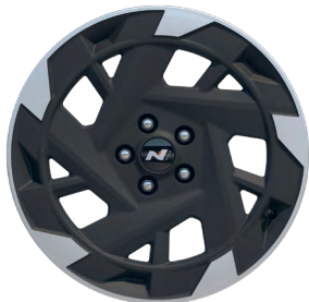
19" kola z lehké slitiny N Line