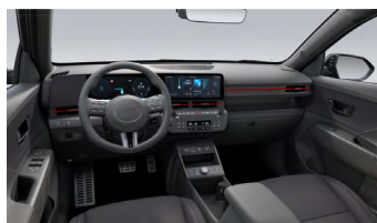
Černý interiér N Line – látkové čalounění sedadel – výhradně pro N Line