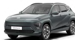
Cypress Green Perleťová Kombinace s černým lakováním střechy Cena: 17 900 Kč