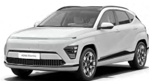
Atlas White Speciální pastelová Kombinace s černým lakováním střechy Cena: 10 000 Kč