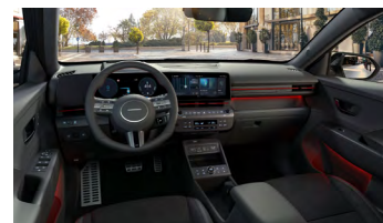
Černý interiér N Line Premium – čalounění sedadel kůže/semiš – výhradně pro N Line Premium

www.porovnejhyundai.cz (Porovnejte si vozy Hyundai s konkurencí)