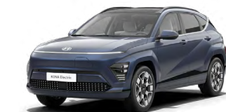
Sailing Blue Perleťová Kombinace s černým lakováním střechy Cena: 17 900 Kč