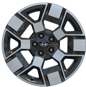
19" kola z lehké slitiny