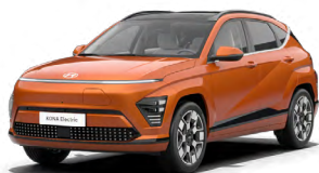
Jupiter Orange Metalická Kombinace s černým lakováním střechy Cena: 17 900 Kč