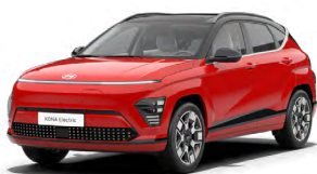
Engine Red Pastelová Kombinace s černým lakováním střechy Cena: 0 Kč