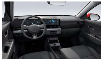
Černý interiér – látkové čalounění sedadel – dostupné pro Smart, Czech edition