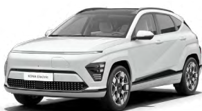
Serenity White Perleťová Kombinace s černým lakováním střechy Cena: 17 900 Kč