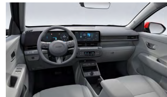
Šedý interiér – látkové čalounění sedadel – dostupné pro Smart, Czech edition