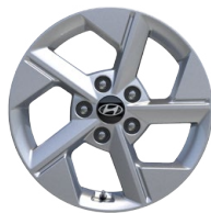
16" kola z lehké slitiny