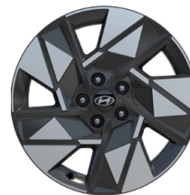
18" kola z lehké slitiny