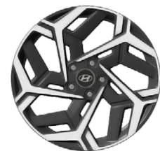
Unikátní N Line 18" kola z lehké slitiny

www.porovnejhyundai.cz (Porovnejte si vozy Hyundai s konkurencí)