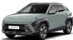
Mirage Green Pastelová Kombinace dostupná také s černým lakováním střechy Cena: 0 Kč