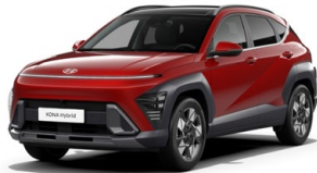
Ultimate Red Metallic Metalická Kombinace dostupná také s černým lakováním střechy Cena: 17 900 Kč