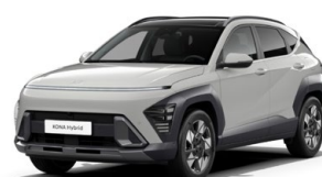
Cyber Gray Metallic Metalická Kombinace dostupná také s černým lakováním střechy Cena: 17 900 Kč