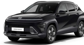
Abyss Black Pearl Perleťová Cena: 17 900 Kč