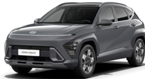
Ecotronic Gray Pearl Perleťová Kombinace dostupná také s černým lakováním střechy Cena: 17 900 Kč