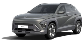
Amazon Gray Metalická Kombinace dostupná také s černým lakováním střechy Cena: 17 900 Kč