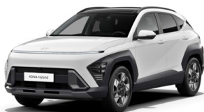
Serenity White Pearl Perleťová Kombinace dostupná také s černým lakováním střechy Cena: 17 900 Kč