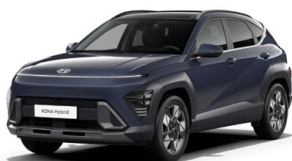
Denim Blue Pearl Perleťová Kombinace dostupná také s černým lakováním střechy Cena: 17 900 Kč